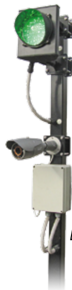
Lámpás-kamerás mérési rendszer